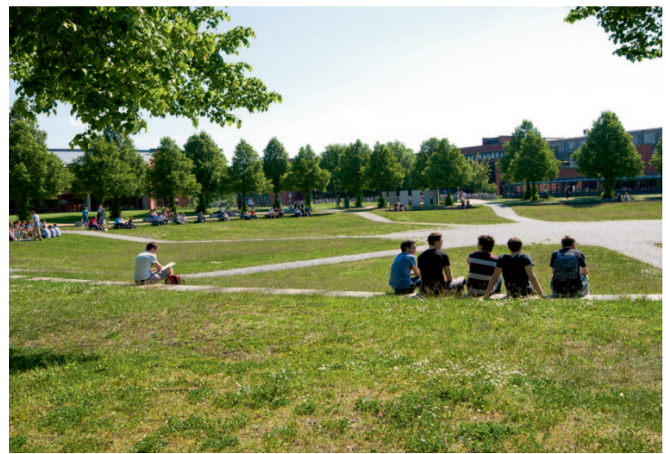
Studieren und Leben auf dem Bayreuther Campus – beste Aussichten.