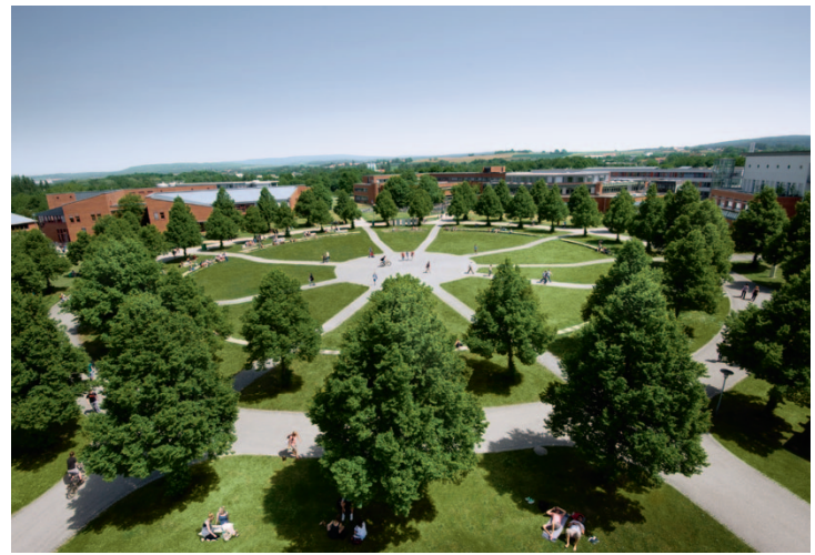
Die Vorteile einer Campus-Uni sind kurze Wege und der enge Kontakt zu den Dozentinnen und Dozenten.