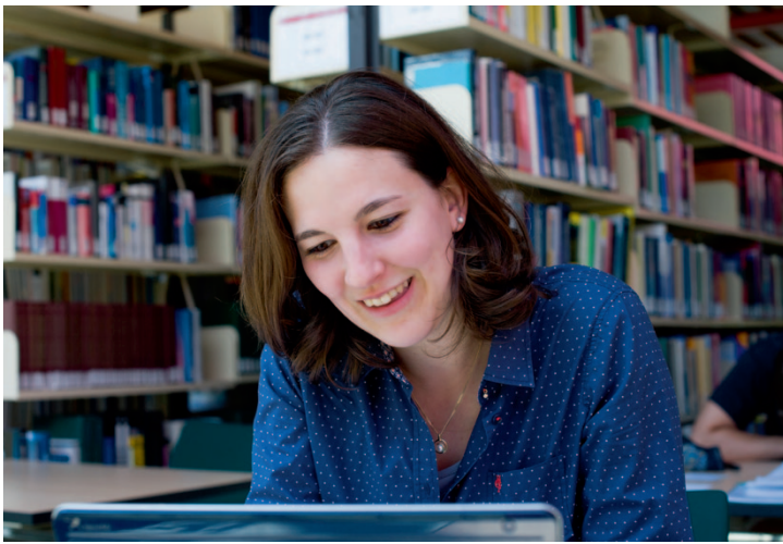
Die gut ausgestattete Bibliothek bietet zahlreiche studentische Arbeitsplätze.